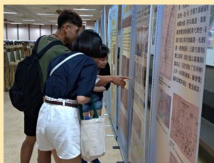
臺灣地圖展-讀者加入尋找臺灣地圖遊戲