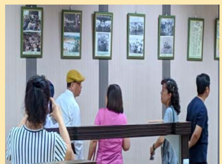
校友回娘家-校友從東方校園舊照尋回青春歲月