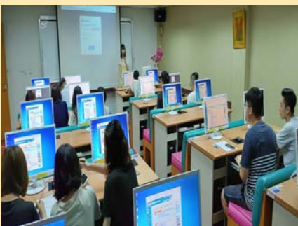
圖書館利用教育舉辦實況