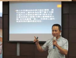
與會者發表校史館參觀心得