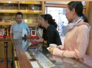
享用咖啡並參與討論