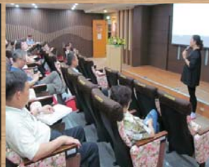
與會者發表校史館參觀心得