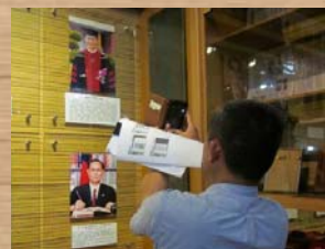
與會者紀錄校史珍輯