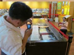
與會者紀錄校史珍輯