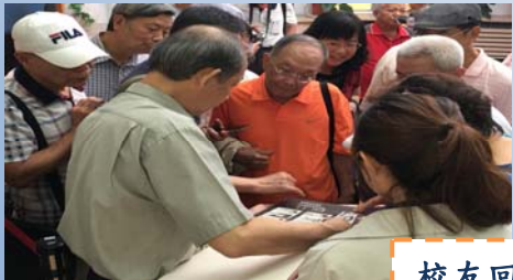
校友回憶青春時光

校史館之設置是希望能完整保存校史文物外，同時更能夠凝聚在校師生與校友對本校認同及向心力，激發全校對本校起源、演變發展之認知。