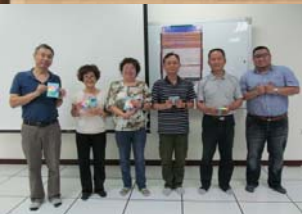
有獎徵答活動合影