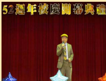
創辦人哲嗣暨圖書資訊處圖 資長於校慶開幕典禮致詞