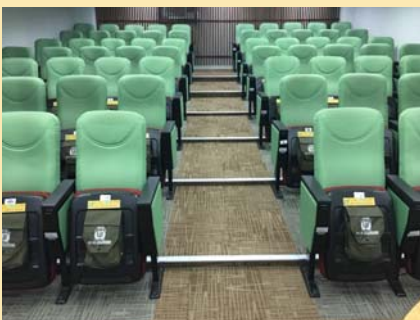
裝修後圖書館四樓 多媒體素養室新貌