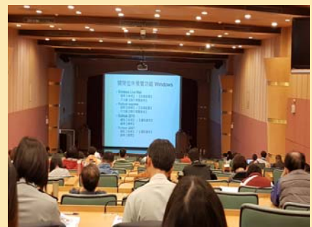
全校資訊安全研習舉辦情況