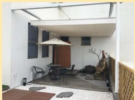
圖書館五樓校史館 新設咖啡庭園竣工