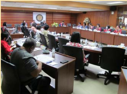
圖書資訊諮詢委員會 會議舉辦情況