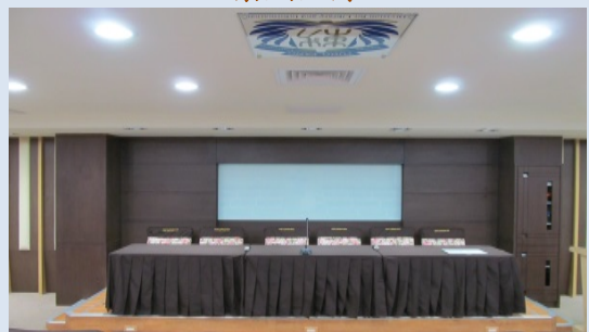
複合式多功能講台