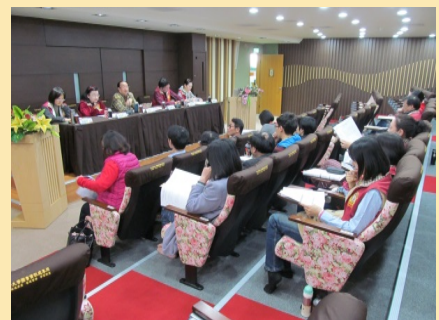
圖書館四樓多媒體視訊研討 暨數位教學廳使用情形