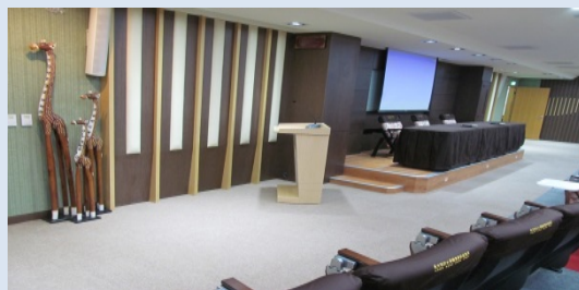
多功能數位系統教學