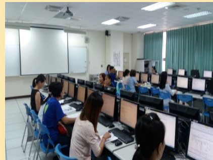
「個人資料檔案清冊盤點 暨風險評估實務演練活動」 活動舉辦情況之二