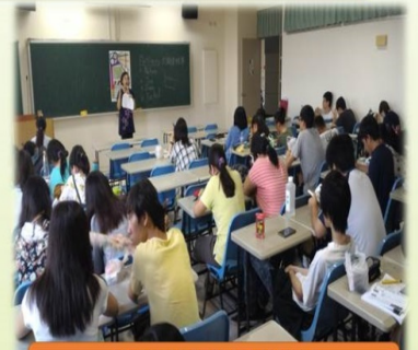
活動剪影 研習實況 2