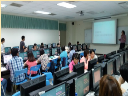
「個人資料檔案清冊盤點 暨風險評估實務演練活動」 活動舉辦情況之一