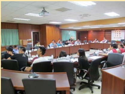
圖書資訊諮詢委員會 會議舉辦情況