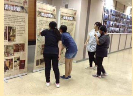
「國立臺灣圖書館-館藏日 治時期美術設計類書展」 展覽舉辦情況之二