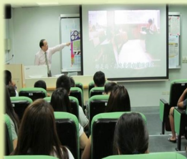
活動剪影 研習實況 3