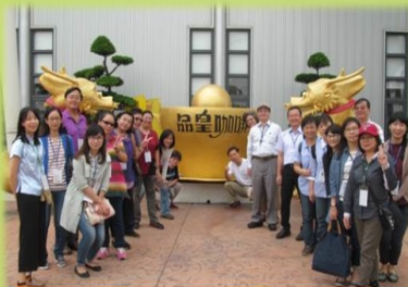
活動剪影 參訪品皇咖啡博物館