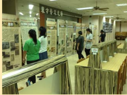
「國立臺灣圖書館-館藏日 治時期美術設計類書展」 展覽舉辦情況之一