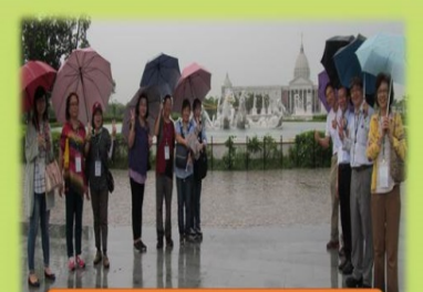
活動剪影 參訪奇美博物館