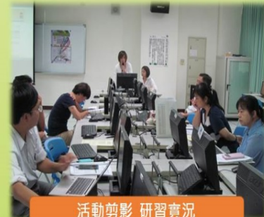
活動剪影 研習實況