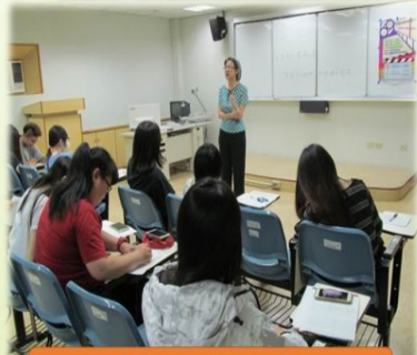
活動剪影 研習實況 1