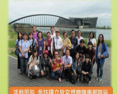
活動剪影 參訪國立故宮博物院南部院區