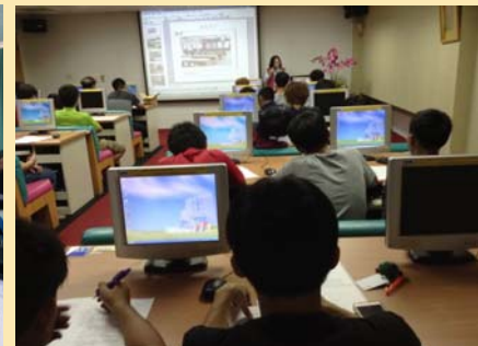
圖書館利用教育課程 舉辦情況