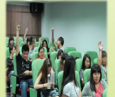
活動剪影 研習實況 4