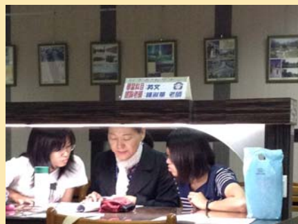
地下一樓閱覽室 「自學中心」諮詢情形