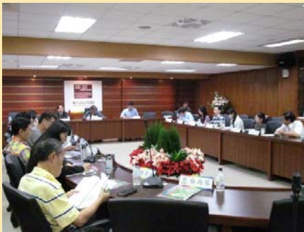
圖書資訊諮詢委員會 會議舉辦情形