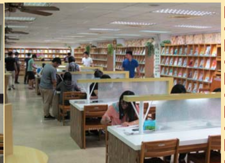
二樓期刊閱覽區 讀者享閱書香