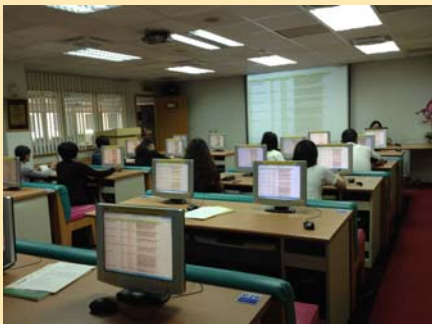
研究所碩士班學生 參與圖書館利用教育課程