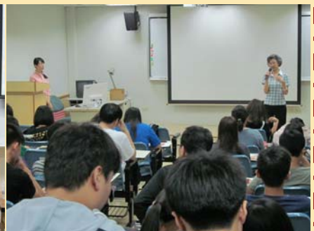
外語學習資源利用訓練 學生聆聽講演活動