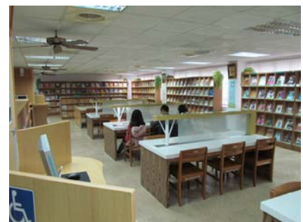
圖書館 2 樓期刊閱覽區