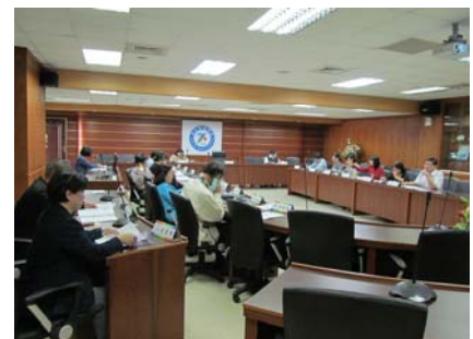
圖資諮詢委員會議舉辦情形