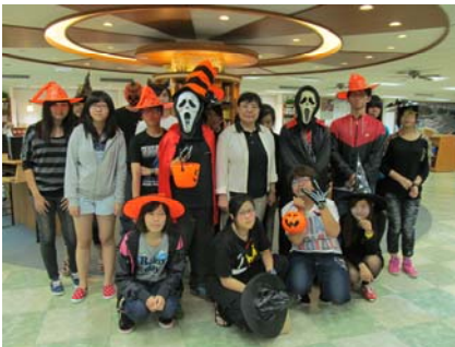
萬聖節活動圖書館張組長 愷儀與學生合影