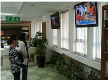
圖書館 1 樓數位資訊播放區