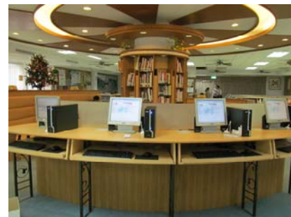
圖書館 1 樓資訊檢索區