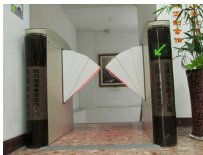
圖書館 1 樓通往 B1 的門禁系統