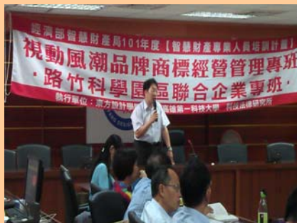
視動風潮品牌商標經營管理專班授課情形