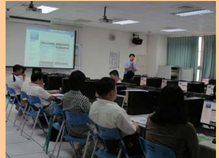
圖書館 2012 學術電子資源利用研習會舉辦情形