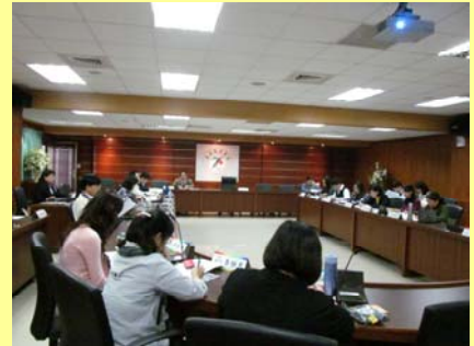
圖書及資訊諮詢委員會 會議召開情形