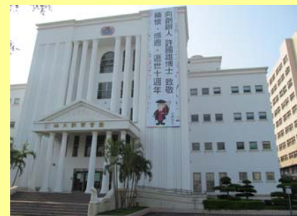
向創辦人 許國雄博士致敬 勉懷・感恩・逝世十週年