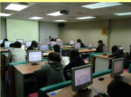
圖書館利用教育課程 學生學習使用電子資源