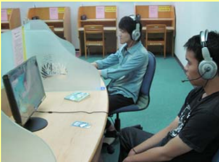
多媒體中心 讀者觀賞館藏影片