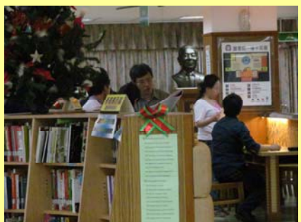
新書展示區 讀者享閱新書