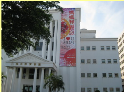
向全東方的母親們致賀 母親節祝賀活動